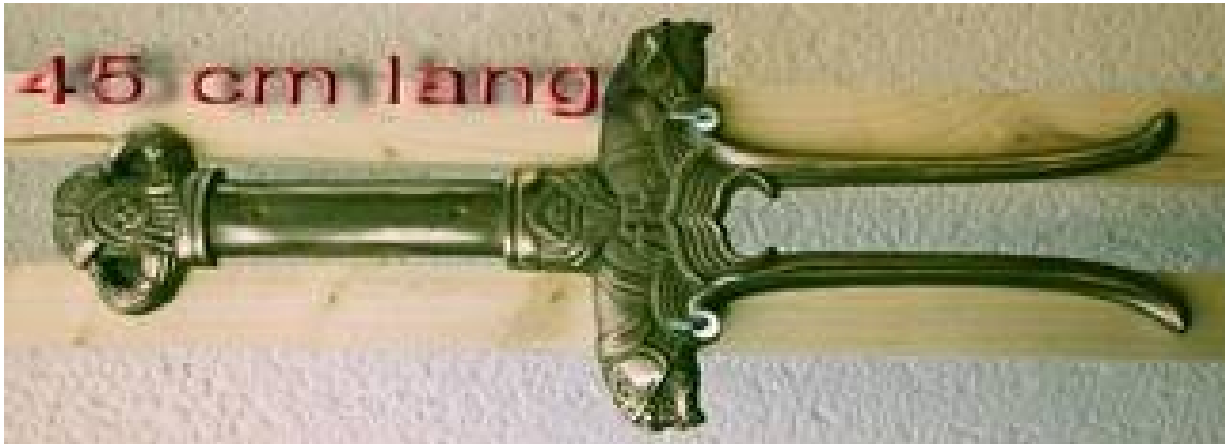
Prunkschwert „Conan“, als Wand- oder Türschmuck

Nr. G04 Griffhalbschale in Bronze gegossen, passend zu